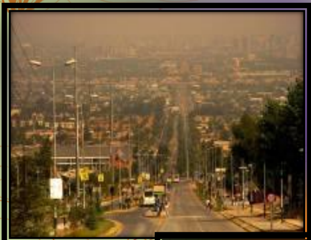
Imágenes de Peñalolén

Nuestra presencia en Peñalolén está situada en un sector poblacional, donde personas trabajadoras y pobres ocupan viviendas pequeñas que con mucho esfuerzo van ampliando, ocupando las faldas de la Cordillera de los Andes. Allí se percibe una educación estatal de baja calidad, prolongando los círculos de pobreza, pues la educación es un medio para salir adelante.