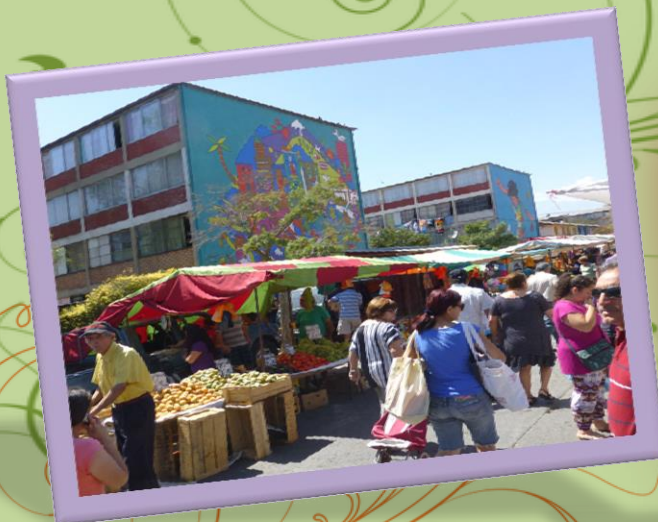
Imágenes de la Comuna San Miguel

Tenemos la misión de hacer vida el Carisma Congregacional entre la gente sencilla de nuestro pueblo.